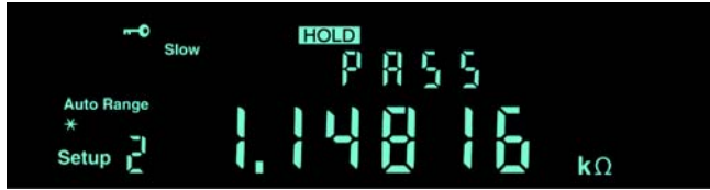
DMM4020 上的极限比较模式。

专用前面板按钮可以快速进入常用的功能和参数，缩短仪器设置时间。您不必再搜索软件菜单，查找所需的功能。