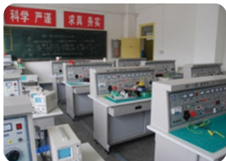
教学和实验室领域

应用于产品研发调试、质量控制和检测、生产自动化测试和教学实验等场景，可满足多样化的测试需求。